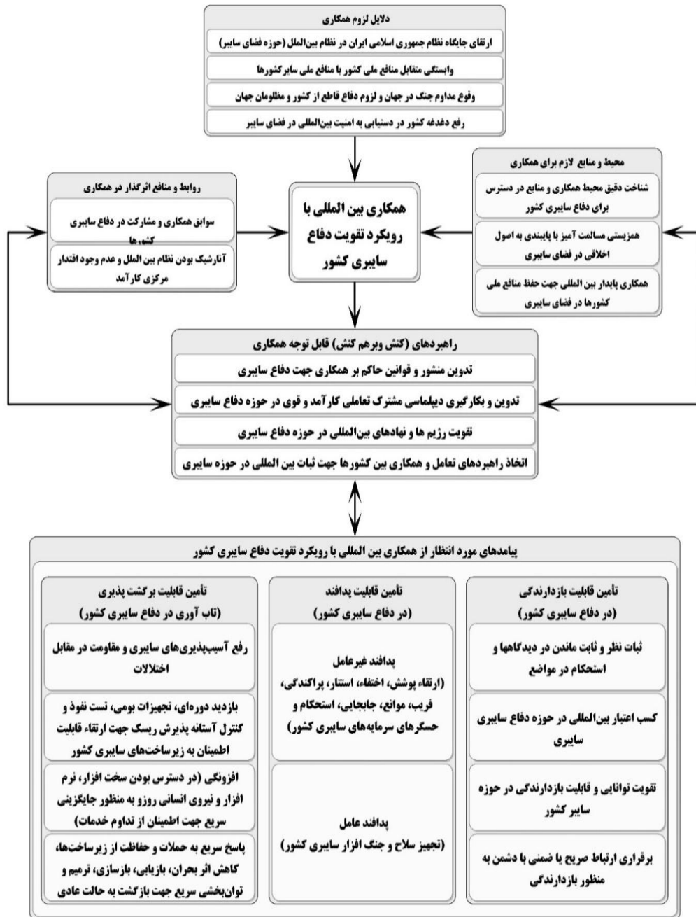
مدل فرایندی تأثیر همکاری بین‌المللی بر دفاع سایبری کشور