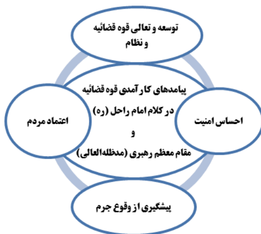
شکل ۲: نتایج کارآمدی قوه قضائیه (منبع: زین‌الدینی، ۱۳۹۵: ۱۶۱)

موضوع کارآمدی به‌عنوان مفهومی اساسی در نظریه‌های مدیریتی همواره مورد توجه اندیشمندان و مدیران بوده است. اهمیت این موضوع برای دستگاه قضایی که متولی گسترش عدالت در کل حاکمیت است، بسیار اساسی‌تر است. چنان‌که اشاره شد این امر بسیار مورد تأکید مقام معظم رهبری نیز بوده و اصلی‌ترین پیامدهای کارآمدی قوه قضائیه در کلام ایشان و امام راحل در نمودار زیر قابل مشاهده است (زین‌الدینی، ۱۳۹۵: ۱۶۱).