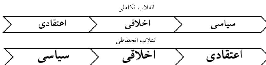
شکل شماره ۱. مراحل انقلاب‌های انحطاطی و تکاملی

انقلاب و هریک از جنبه‌های آن ممکن است یکی از دو جهت مخالف را داشته باشند: تکامل یا انحطاط. از این رو دوگونه انقلاب داریم؛ انقلاب تکاملی و انقلاب انحطاطی.