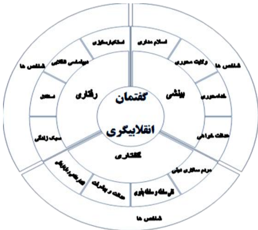
شکل شماره ۴. مدل تحقیق

توسط متغیر مکنون خود توضیح داده می‌شود. مقدار این شاخص باید از ۰,۴ بزرگ‌تر و در فاصله اطمینان ۹۵٪ معنادار باشد. معنی‌داری این شاخص توسط آماره تی (t) آزمون می‌شود. همان‌طور که در جدول شماره ۶ مشخص شده است، بارهای عاملی که از مقدار ۰/۴ بزرگ‌تر شده‌اند، در الگو باقی مانده و دلیلی برای حذف آن‌ها وجود نخواهد داشت؛ اما شاخص‌هایی که بار عاملی کمتر از ۰/۴ اختیار کرده‌اند از فرایند الگو حذف می‌شوند. همین فرایند برای شاخص‌ها نیز صورت گرفته که در ادامه آورده شده است. پس از طی نمودن فرایند مذکور درنهایت سه بعد، ۱۲ مؤلفه و ۱۳۷ شاخص که بیانگر گفتمان انقلابی‌گری از دیدگاه امامین انقلاب هست، به دست آمد که در جداول شماره ۷، ۸ و ۹ آمده است: