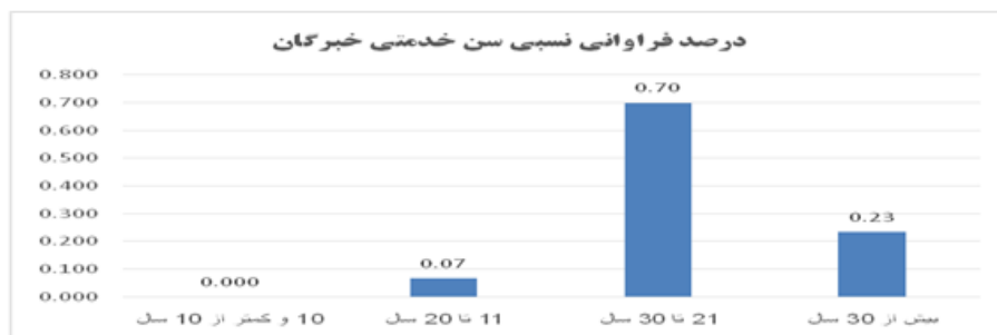
نمودار شماره ۱- درصد توزیع فراوانی سنوات خدمتی خبرگان

در این بخش توزیع فراوانی خبرگان اعم از سنوات خدمتی، جایگاه سازمانی، تحصیلات و رشته تحصیلی و سابقه اجرایی در نمودارهای شماره ۱ تا ۴ ارائه می‌شوند.