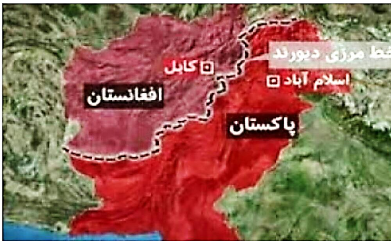
نقشه شماره ۳ - خط مرزی دیوراند

با حمایت سازمان ملل و آمریکا برای کنترل عبور و مرور در مرز مشترک با افغانستان، اقدام به ایجاد موانع (سیم‌خاردار) نمود؛ بنابراین مردم ساکن در دو سوی مرز پیش گفته، فقط می‌توانند با داشتن ویزا از مرز عبور کنند. وجود این مرز سبب اختلاف بین افغانستان و پاکستان شده است. دولت اسلام‌آباد مرز دیوراند را به‌عنوان مرز بین‌المللی میان دو کشور، به رسمیت می‌شناسد. این مرز در واقع پشتون‌های دو طرف مرز را از هم جدا کرده است. افغانستان حداقل ۱۰۳ هزار کیلومترمربع از خاکش را در اثر این قرارداد از دست داد (تاجیک و همکاران، ۱۳۹۵)