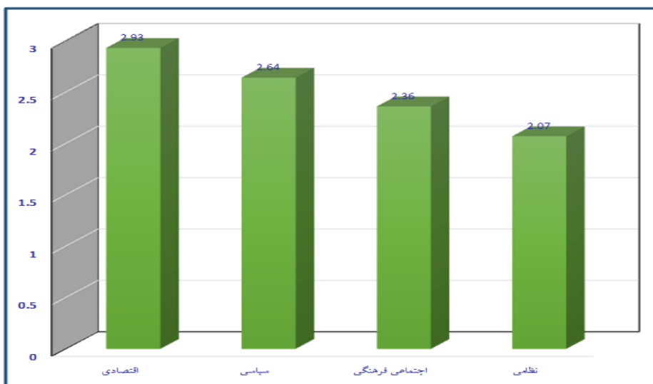
نمودار شماره ۲: رتبه‌بندی مؤلفه‌های فرصت‌ها